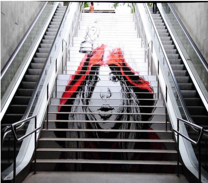
Stazione a Barcellona, progetto realizzato da Swab