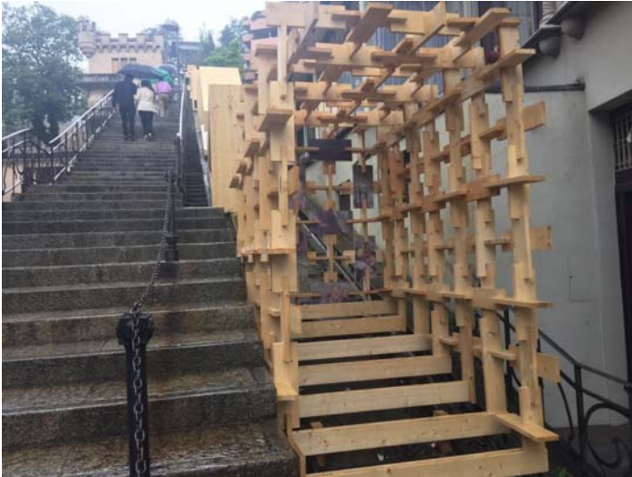
Via Crucis su rotaie, progetto realizzato dagli studenti dell'Accademia di architettura dell'USI