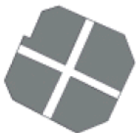
mercato di porta palazzo _ torino sup. mq. 51.300