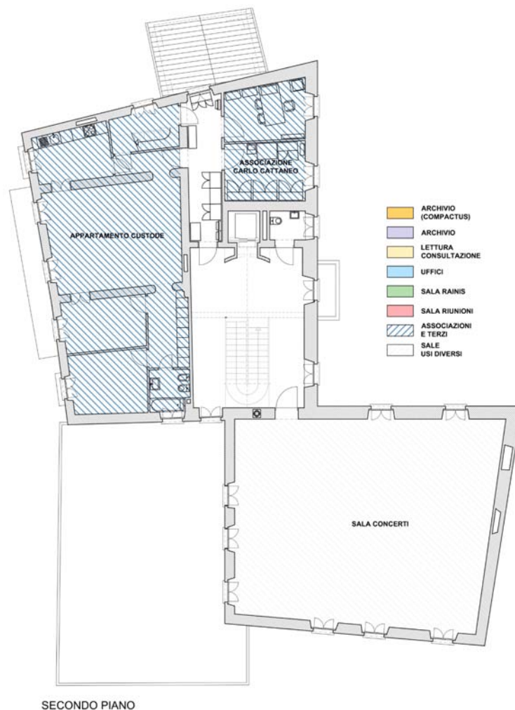
Ex Casa Comunale – Planimetria secondo piano