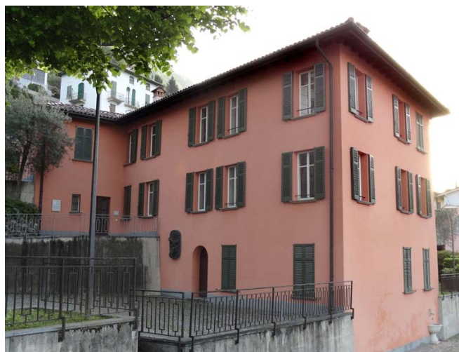
Casa Carlo Cattaneo - Castagnola

Acquistata nel 1972 dal Comune di Castagnola, la casa che ospitò così illustri personaggi divenne, nel 1980, sede dell'Archivio Storico della Città di Lugano.