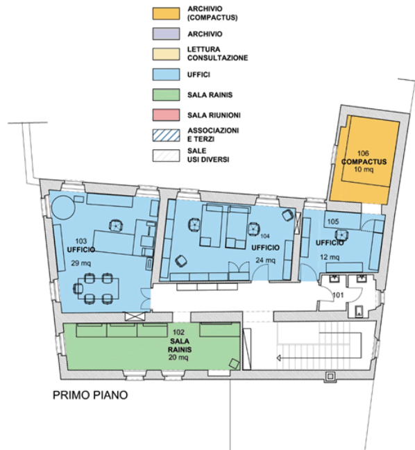
Casa Carlo Cattaneo – Planimetria primo piano

Il totale di superficie disponibile è di ca. 230 mq, esclusi gli spazi di circolazione, le scale, i disimpegno, i locali tecnici e i WC.