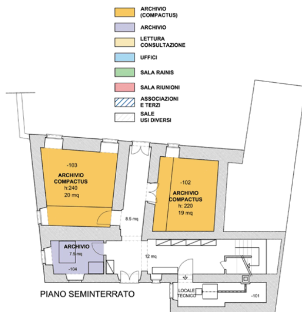
Casa Carlo Cattaneo – Planimetria piano seminterrato