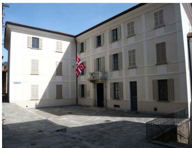
Ex Casa Comunale di Castagnola

Si sottolinea che i locali a uso pubblico (sala matrimoni, sala rinfreschi e sala concerti) non saranno interessati dai lavori e manterranno la stessa funzione e gli stessi contenuti che hanno attualmente.